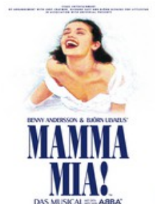
BENNY ANDERSSON & BJÖRN ULVÄS MAMMA MIA! DAS MUSICAL MIT ABBA